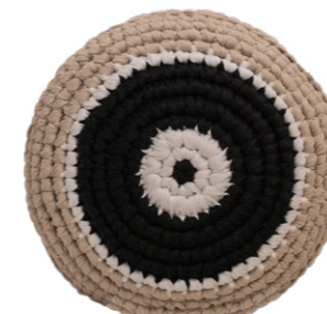
Μαύρο / Black Δύναμη / Power