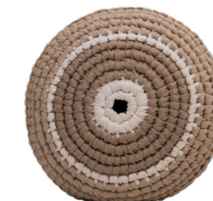
Λευκό / White Πλούτος / Wealth