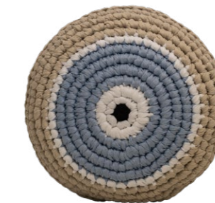
Τιρκουάζ / Turquoise Υγεία / Health