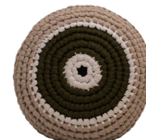
Πράσινο / Green Ευτυχία / Happiness