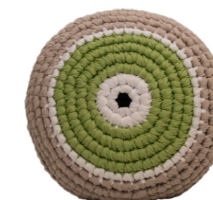
Ανοιχτό Πράσινο / Light Green Επιτυχία / Success