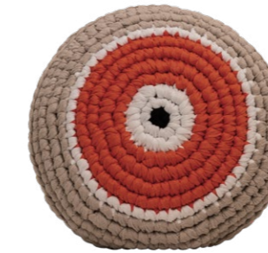
Κοραλί / Coral Προστασία / Protection