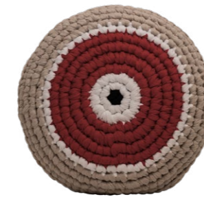
Κόκκινο / Red Κουράγιο / Courage