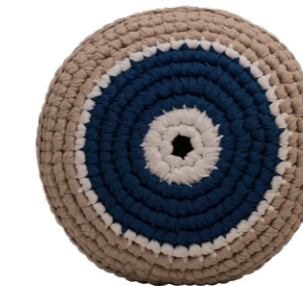
Αμέθυστος / Amethyst Νοημοσύνη / Intelligence