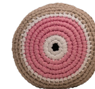
Ροζ / Pink Αγάπη / Love